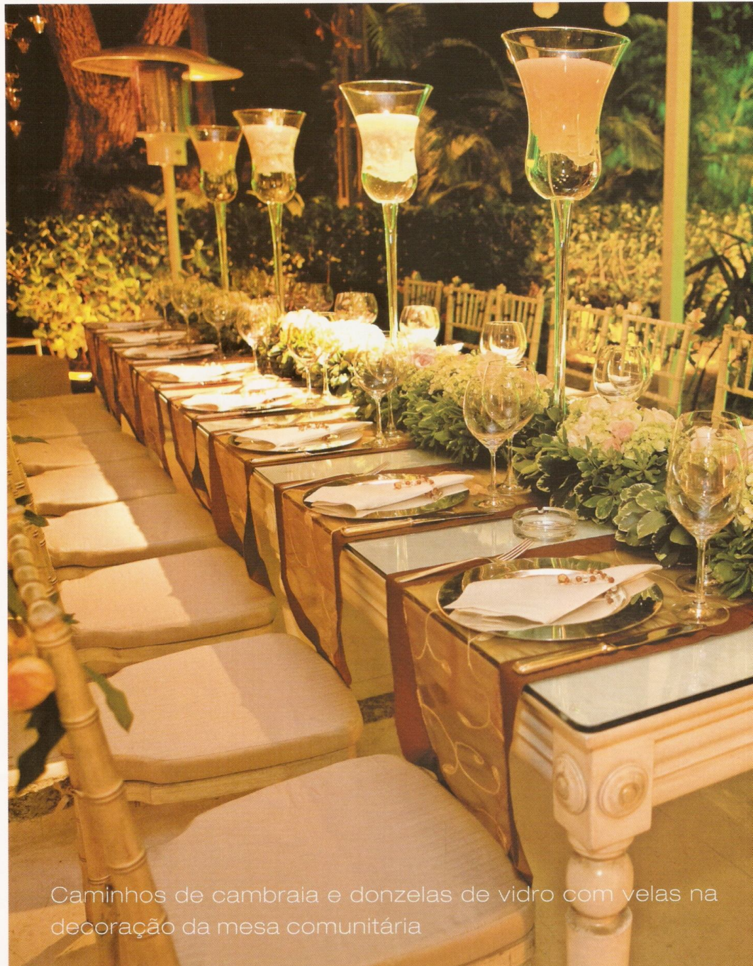
Caminhos de cambraia e donzelas de vidro com velas na decoração da mesa comunitária