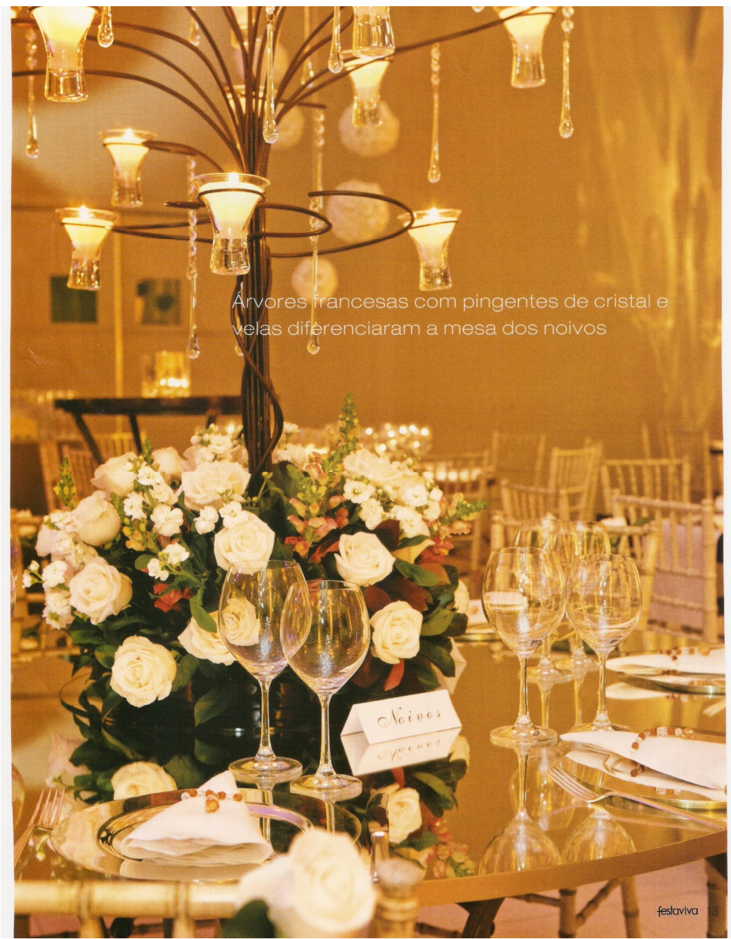
Árvores francesas com pingentes de cristal e velas diferenciaram a mesa dos noivos