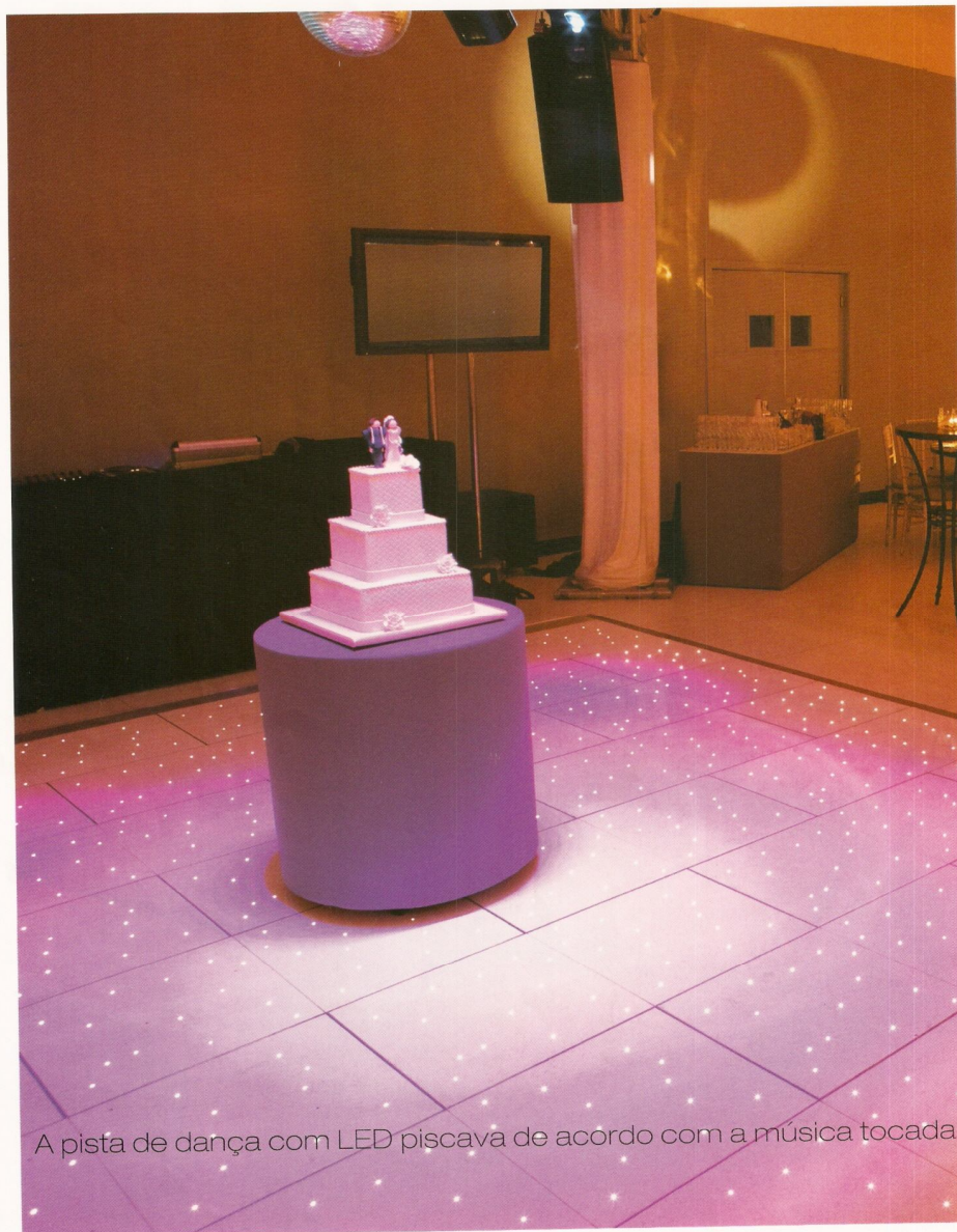
A pista de dança com LED piscava de acordo com a música tocada